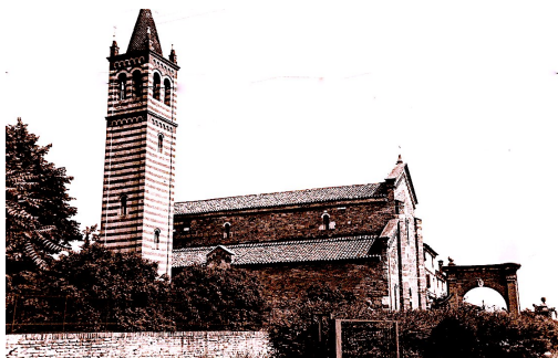
San Pietro di Legnago. Chiesa Romanica di San Salvaro

Gloria a Cristo divin Salvatore alla sua Divina Madre ed a San Giuseppe Lode ai nostri antenati che nel secolo XII edificarono questo tempio monumento nazionale